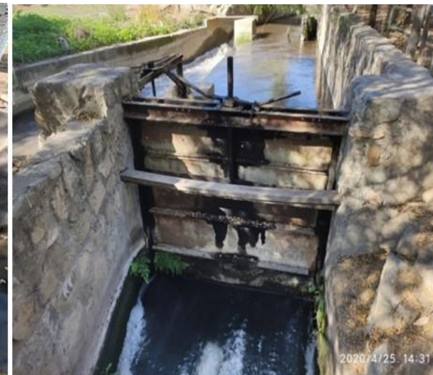
Foto 3. Canal Lorino.