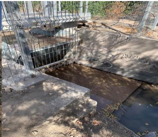
Foto 2. Canal Montenegro.