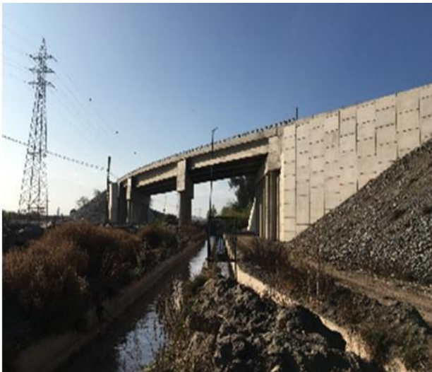
Foto 1. Canal La Pirca.