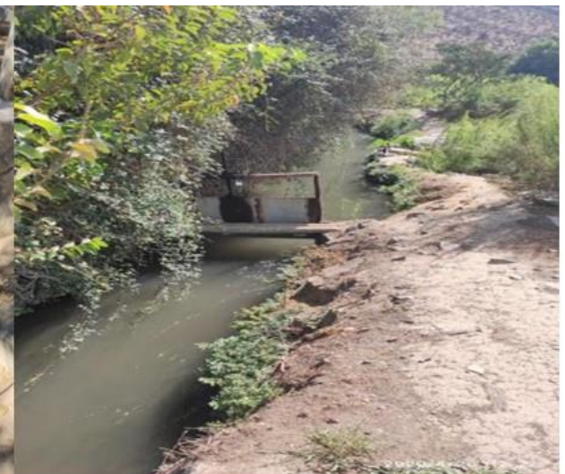
Foto 4. Canal Purehue.